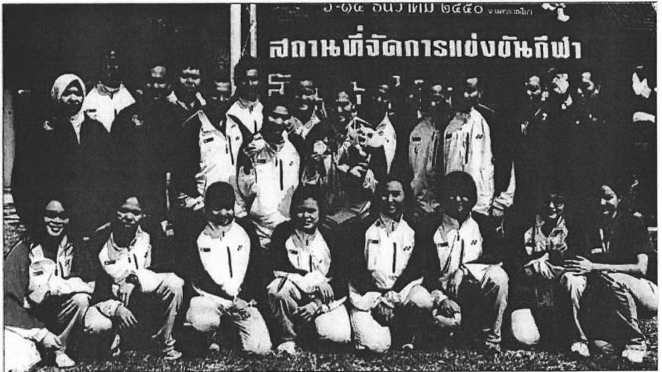
BUAT KENANGAN: Para pesilat negara bergambar untuk kenangan di luar Dewan Perbandaran, Sungnoen, di mana pertandingan silat diadakan

“Tetapi kami perlu meningkatkan lagi persiapan mental mereka agar tidak mudah terkejut oleh suasana pertandingan ataupun reputasi lawan seperti yang ditunjukkan oleh Rafili,” tambah pengarah teknikal itu.